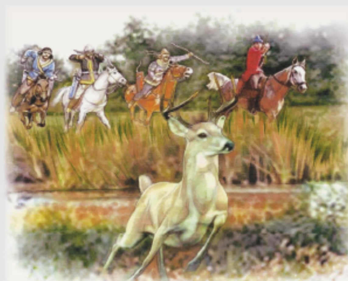
A csodaszarvas üldözése

A krónikások történeteikben ezzel a hunok és a magyarok rokonságát hangsúlyozták.