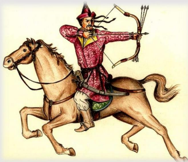
Lóról hátrafelé nyilazó magyar harcos

Ugyanakkor régészeti leletek a földművelés meglétét is mutatják, és ez legalább aratásig egy helyhez kötötte őseinket, ezért ezt az életmódot félnomádnak nevezik .