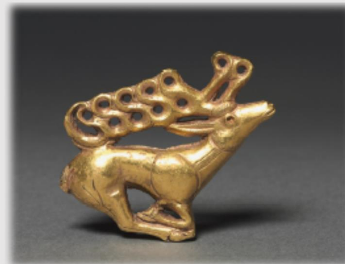
A szkíta aranyszarvas