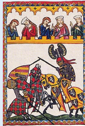
Háborúskodás, lovagi tornák

A lovagok mellett szolgáló és tanuló, nemesi származású gyermekeket apródoknak nevezték. Amikor az apródok elérték a kamaszkort, már háborúba is elkísérhették urukat.