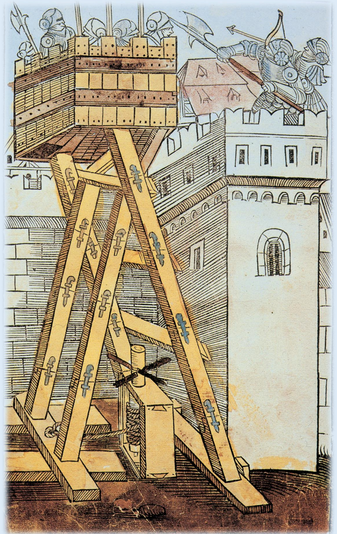
Fából készült ostromtorony

Jeruzsálemet újra elfoglalták a muszlimok.